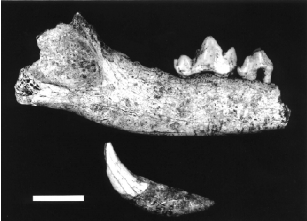
Fig. 2. Fragmento de mandíbula derecha con p4 y m1 (vista lateral) y canino inferior izquierdo (vista lingual) de Chrysocyon brachyurus (MLP 1.IX.00.62) procedentes del sitio arqueológico La Bellaca 2, noreste de la provincia de Buenos Aires. Escala: 20 mm.

Right mandibular fragment with p4 and m1 (lateral view), and left lower canine (lingual view) of Chrysocyon brachyurus (MLP 1.IX.00.62) from the archaeological site La Bellaca 2, northeastern Buenos Aires province. Scale: 20 mm.